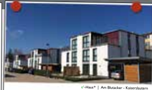
HF-Haus* | Am Büttacker - Kaiserslautern

Junges Wohnen Wir schaffen bezahlbaren Wohnraum in guten Lagen. Unser Ziel ist es mittels moderner Architektur eine sinnvolle städtebauliche Nachverdichtung zu erreichen.