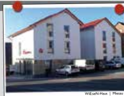
WEGEN-HORN | Meisau

Wohnen im Alter Wir bauen für Sie marktgerechte Wohnimmobilien mit System. Unsere durchdachten und vielfach bewährten Raumkonzepte sind altersgerecht und rollstuhlfreundlich bei energieeffizienter Bauweise. Bei unseren Projekten steht Preis & Leistung in Relation!