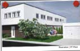
Illustration | HF-Haus

Verfügen Sie über Grundstücke in guten Lagen?