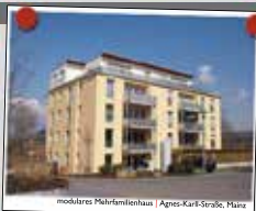
modulares Pfleheimhaus | Agnes-Karl-Straße, Mainz

Wohnen im Alter Wir bauen für Sie marktgerechte Wohnimmobilien mit System. Unsere durchdachten und vielfach bewährten Raumkonzepte sind altersgerecht und rollstuhlfreundlich bei energieeffizienter Bauweise. Bei unseren Projekten steht Preis & Leistung in Relation!