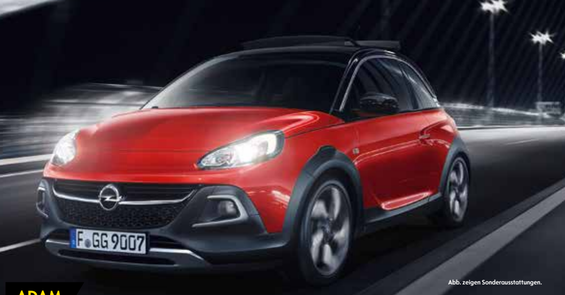
Abb. zeigen Sonderausstattungen.