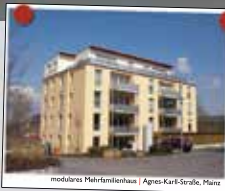
moderne Mehrfamilienhaus | Agnes-Karl-Straße, Mainz

Wohnen im Alter Wir bauen für Sie marktgerechte Wohnimmobilien mit System. Unsere durchdachten und vielfach bewährten Raumkonzepte sind altersgerecht und rollstuhlfreundlich bei energieeffizienter Bauweise. Bei unseren Projekten stehen Preis & Leistung in Relation!