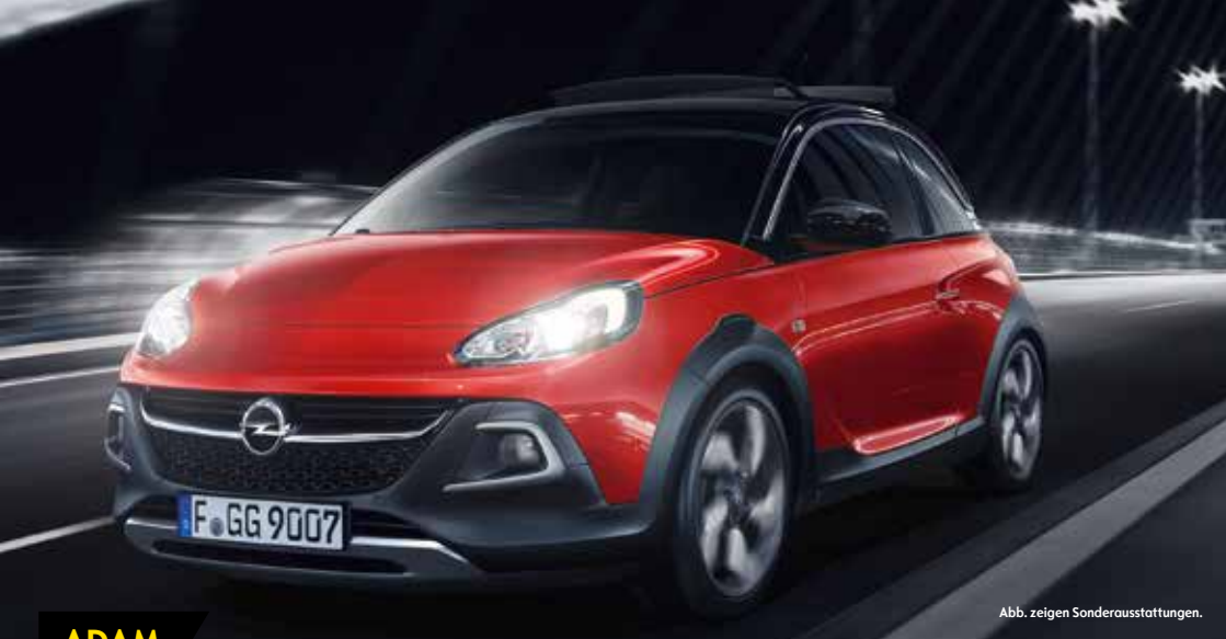
Abb. zeigen Sonderausstattungen.