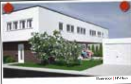
Illustration | HF-Haus

Verfügen Sie über Grundstücke in guter Lage?