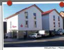
WEGEN-Haus | Metzau

Wohnen im Alter Wir bauen für Sie marktgerechte Wohnimmobilien mit System. Unsere durchdachten und vielfach bewährten Raumkonzepte sind altersgerecht und rollstuhlfreundlich bei energieeffizienter Bauweise. Bei unseren Projekten stehen Preis & Leistung in Relation!